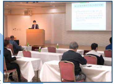
優良産業廃棄物処理業者 育成研修会