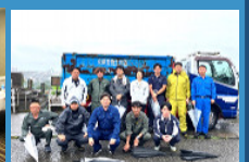
清掃ボランティア活動