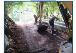
不法投棄の原状回復促進事業