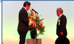
総会での功労者等の表彰