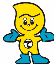
産業廃棄物適正処理のマスコット 「てき丸君」