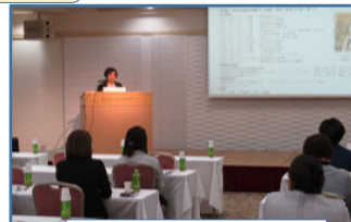
女性活躍推進セミナー