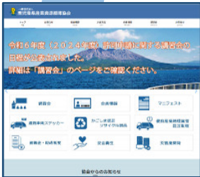
協会ホームページ