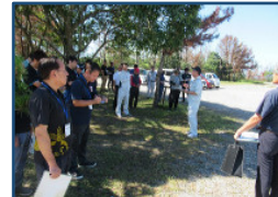
災害廃棄物エリア別会議